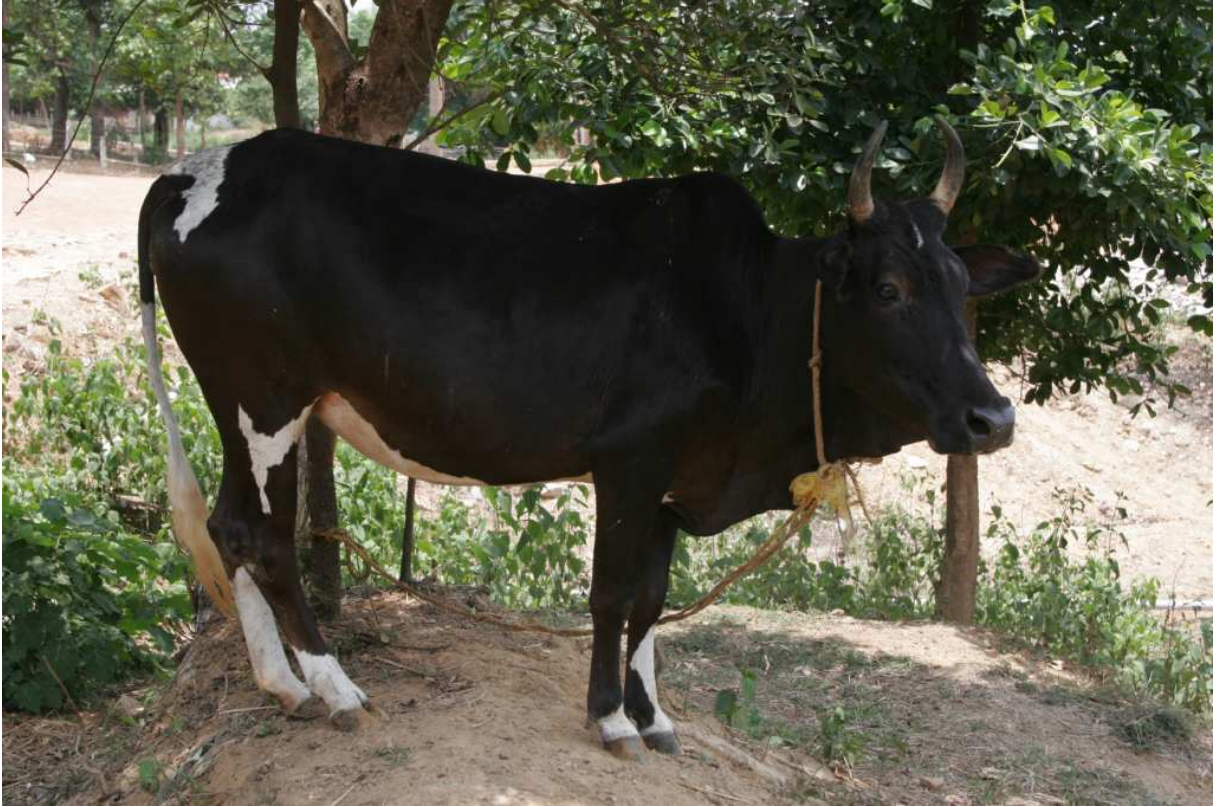
ಪೋನ್ವಾರ್ -ಉತ್ತರ ಪ್ರದೇಶ

ಫಿಲಿಭಿತ್ ಜಿಲ್ಲೆ ಪುರಾನ್‌ಪುರ್ ತಾಲೂಕು ಪೋನ್ವಾರ್ ಕರೆಯುತ್ತಾರೆ. ಹೈನುಗಾರಿಕೆಯ ಧಾರು ಜನಾಂಗದವರ ತಳಿಯ ತವರು. ನಿರ್ದಿಷ್ಟವಾಗಿ ಹೇಳಬೇಕೆಂದರೆ ಮೈನಾಕೋಟ್, ಕುಲಕಸುಬು. ಒಂದು ಜನಾಂಗ ಇದನ್ನೇ ನಂಬಿ ಶತಮಾನಗಳಿಂದ ಮಜ್ಜರಾ, ಭಿರ್ಕೇರಾ ಊರುಗಳು ಈ ಅಪೂರ್ವತಳಿಯನ್ನು ಬದುಕುತ್ತಿದೆಯೆನ್ನುವ ಅಂಶವೇ ಈ ತಳಿಯ ಉಪಯುಕ್ತತೆಯನ್ನು