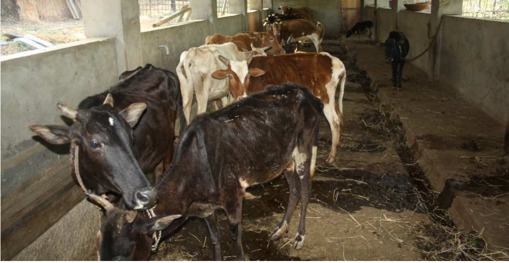
ಮಲೆನಾಡು ಗಿಡ್ಡ ತಳಿ ಸಂರಕ್ಷಣೆ ಮತ್ತು ಸಂವರ್ಧನ ಕೇಂದ್ರ, ಭಾನ್ವಳಿ