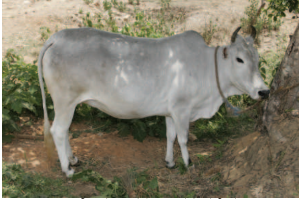
ಖೇರಿಗರ್ ಹಸು, ಉತ್ತರ ಪ್ರದೇಶ

ನಂಬಿ; ಈ ತಳಿಯೊಂದು ಅಚ್ಚರಿ. ಕಾರಣ ಇದರ ಆಹಾರ. ಇದರ ಆಹಾರಸೇವನೆಯ ಪ್ರಮಾಣಕ್ಕೂ ಇದರ ಕಾರ್ಯಸಾಮರ್ಥ್ಯಕ್ಕೂ ಒಂದಕ್ಕೊಂದು ಅರ್ಥಾತ್ ಸಂಬಂಧವಿಲ್ಲ. ಇಷ್ಟೇ ತಿಂದು ಅಷ್ಟು ಹೊತ್ತಿತೇ? ಅಷ್ಟು ನಡೆದಿತೇ? ಅಷ್ಟು ಊಳಬಲ್ಲದೇ? ಎಂದು ಮೂಗಿನವೇಲೆ ಬೆರಳಿಡುವ ಹಾಗಿದೆ ಖೇರಿಗರ್.